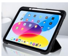
フタを三角に折りたたんでスタンドとして使えます。 2段階の角度調整が可能です。