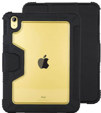
Appleロゴも見え、iPadの本体カラーを楽しめるデザイン。

背面は透明なポリカーボネイト。周囲は四隅が厚くなっており、iPadの衝撃を軽減させます。