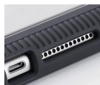
保護ケースを装着したまま充電ケーブル挿入可能。スピーカーからの音も聞こえ、電源ボタン・音量ボタンも押せます。