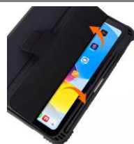
カバーの開閉でON&OFF。 バッテリーの節約に役立ちます。