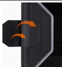
開閉しやすいマグネット式バックル