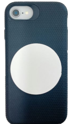
ステッカー白イメージ iPhone8