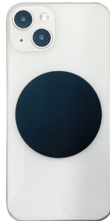
ステッカー黒イメージ iPhone13