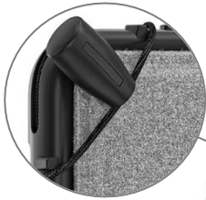
キーボード利用時の持ち運びに便利なゴムバンド付(一ヶ所)

ポリカーボネート+TPU素材の保護ケースです。タブレットを衝撃から保護し、本体の破損を防ぎます。